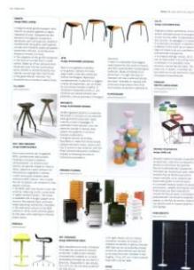
DOMUS LUGLIO 2010 P136 LUGLIO AGOSTO 2010 P73