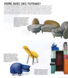
ESPACES CONTEMPORAINS SVIZZERA P189