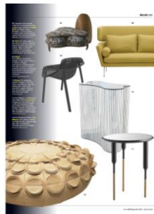
IDFX UK GIUGNO 2010 P21