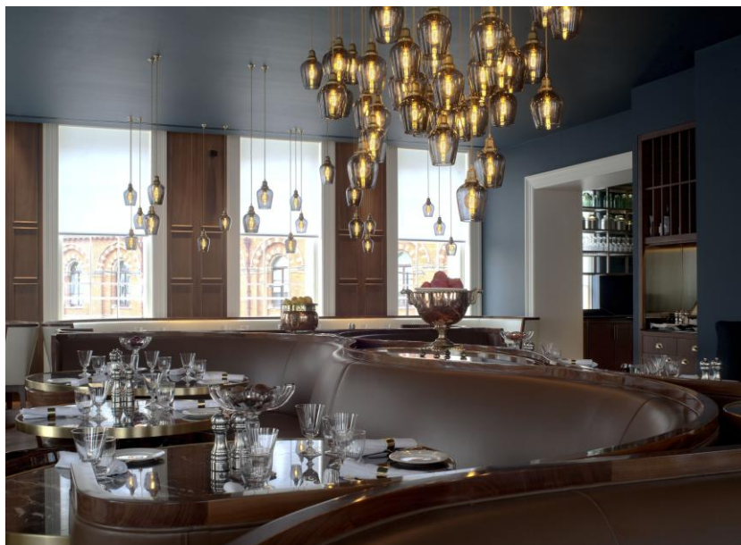
Ristorante Plum + Spilt Milk